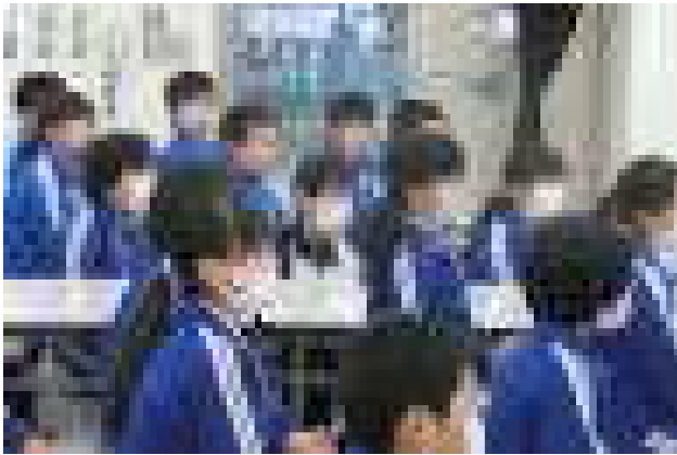
真剣に話を聞く6年生

開会式では緊張した様子の子どもたちでしたが、体を動かしたせいか、閉会式には緊張が和らいで、入学に向けて希望に満ちた表情に変わっていました。4月からの活躍が今から楽しみです。