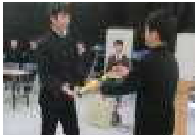
引き継ぎ式の様子