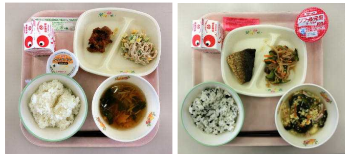
とりにくごまバター焼き かみかみサラダ さばの塩焼き 切干大根サラダ