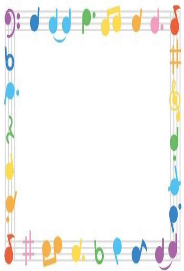
【2，3年生がわかりやすく説明しています】

中学校では、より良い学校を目指すため、生徒自身が考え、活動をしていく機会が多くなります。今回のオリエンテーションも生徒たちで創り上げた企画で、令和4年度のスタートを切る上でとても素晴らしい活動でした。生徒会本部をはじめ、中心となって企画・運営に携わってくれた皆さん、素晴らしい時間をありがとうございました。