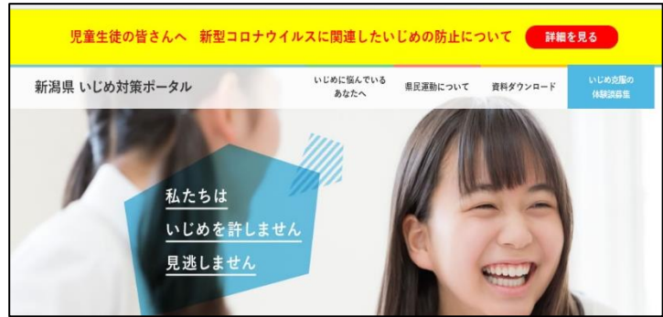
【NHK番組 いじめをノックアウト】