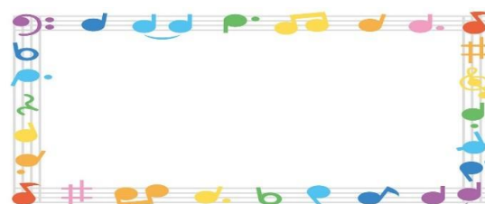
【夜の部 PTA協議会主催 大人向け講演会】