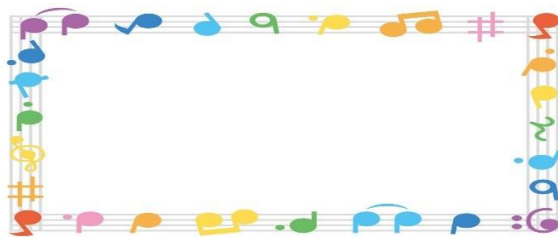
【パンを作っている様子】